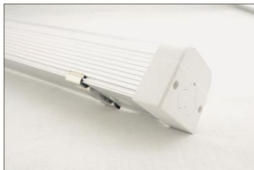
lampa z klipszem zatrzaskowym do montażu natynkowego (w komplecie)