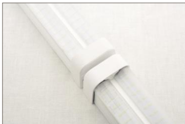
lampy połączone szeregowo