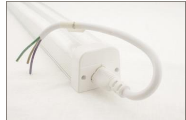
lampa z przyłączem zasilającym - 15 cm