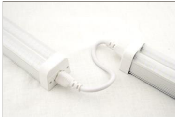
przykład zastosowania łącznika elastycznego - 20 cm