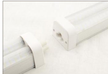
sposób połączenia szeregowego krótkiego