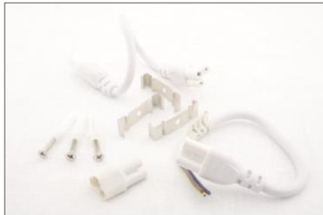
kompletny zestaw montażu natynkowego, łącznik szeregowy krótki,